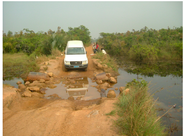
Slechte staat wegen

Het grondgebied van Kapanga, waar Jaak werkzaam is, is ongeveer zo groot als heel België, met naar schatting 125.000 inwoners. Het is een streek van beboste savanne, licht heuvelachtig, verafgelegen van de grote steden (Kolwezi op 675 km, Lubumbashi op 1.000 km). De bevolking is arm en leeft hoofdzakelijk van landbouw en visvangst. Het grote probleem vormen de wegen, die jarenlang niet meer onderhouden zijn en die vooral na het regenseizoen in een erbarmelijk slechte staat verkeren, waardoor de weg in een sponzig, moerassig land verandert. Zodoende is er weinig handel van Kapanga richting stad. De enige handel gebeurt per fiets of per bromfiets. Daardoor is er weinig geld in omloop en is het heel moeilijk om alle kinderen naar school te krijgen of een goede gezondheidszorg aan te bieden. Er zijn veel ongewenste zwangerschappen, veel aan hun lot overgelaten kind-moeders. Het inkomen schommelt tussen de 1 en 2 $ per dag. De huidige politieke situatie in het land speelt ook een zeer negatieve rol: het land stagneert. De afgelegen streek van Kapanga wordt vaak beschouwd als een streek zonder enig economisch belang.